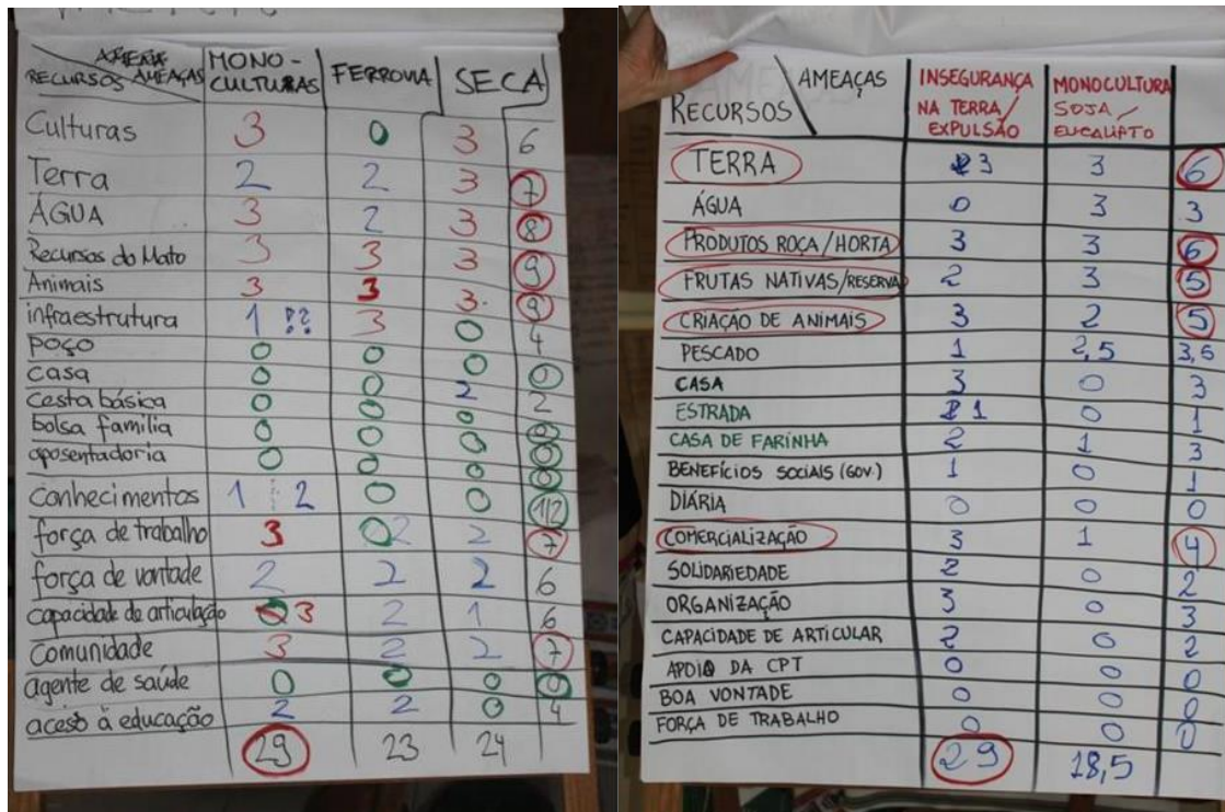
Figura 3: Matriz de vulnerabilidad. Mujeres (i), hombres (d)

El objetivo de este módulo/ejercicio, es determinar las principales amenazas que tienen los impactos más serios sobre los recursos identificados por los y las comunitarias. Además, determinar cuáles son los recursos más vulnerables y afectados por las amenazas.