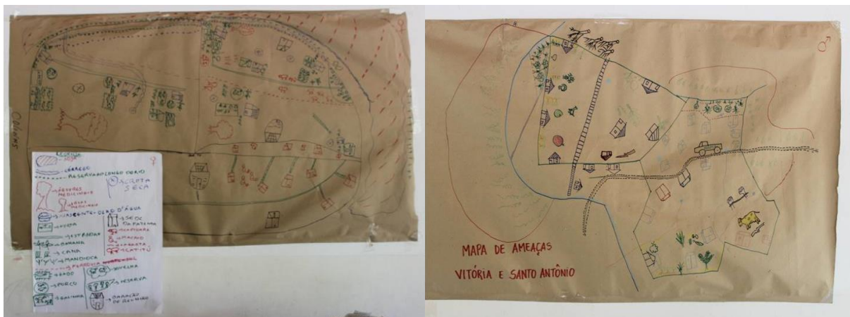
Figura 1: Mapas de amenazas de las mujeres (izquierda) y las hombres (derecha).

Los y las participantes del taller dibujan un mapa de su comunidad, indicando las áreas en riesgo por ciertas amenazas climáticas, naturales o provocadas por el ser humano. Los participantes discuten acerca de los cambios en la frecuencia y la intensidad de amenazas pasadas.