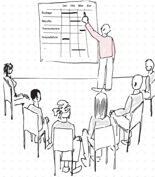
Nonometata tso nufiafia enelia nti