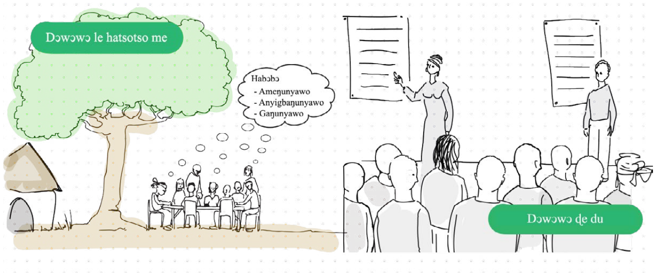
Nɔnɔmetata tso Aɔaɔnyu gbalɛvi 1-a nyi : Nuvavemea nyiti bubu

Dɔ sia ava eme le hatsotso vovowo, xexleme sɔsɔewo le nɔtsu kple nyɔnu fe xexleme nu. Hatsotso deɔsiade ade dukɔ fe nɔnɔme afia (ame xexleme suetɔwo, sɔhewo, agbale manya xlelawo, fiahawo, xɔse hawo, nufialawo, lamese dɔwɔlawo kple bubuwo...)