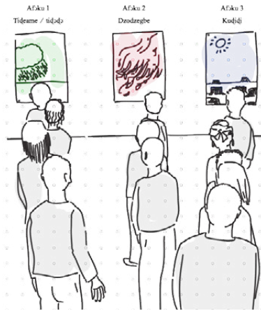
Nɔnɔmetata tso Aɔaɔɔ gbalɛvi 1-a ɔti: nufiafia etɔlia