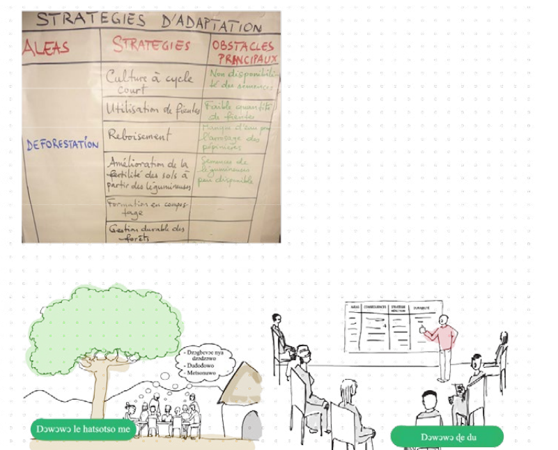
Nɔnɔmetata tso nufiafia adelia ŋuti