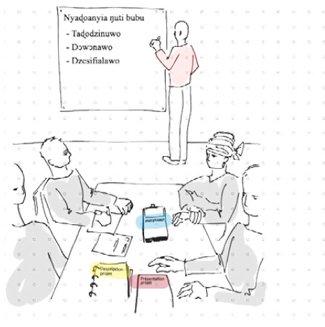
Nɔnɔmetata tso Aḡaḡu gbalēvi 1-b ḡti : ḡḡḡoanyia ḡuti bubu